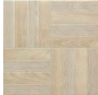
45x45 Bahia IV