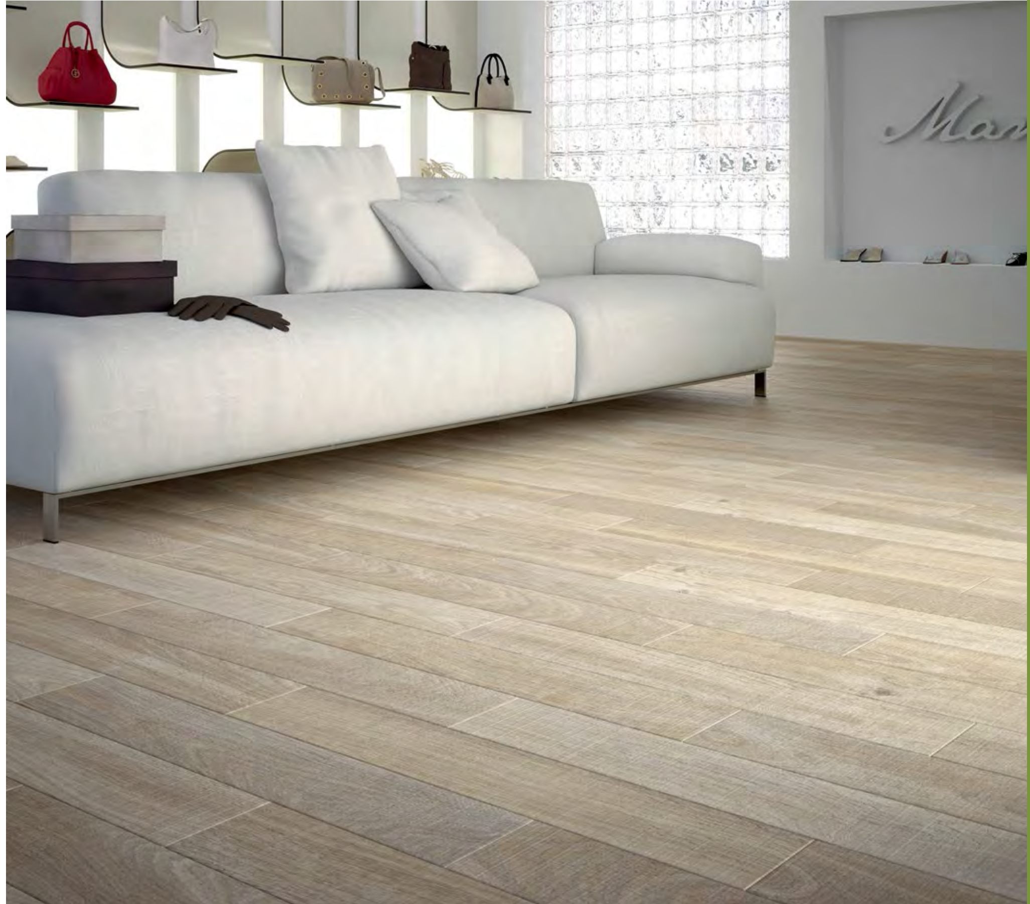
≡ Pavimento: Amazonia Fresno 15 x 80.